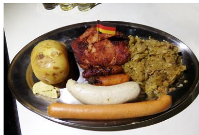
Tábua Alemã 2-3 Pers com