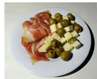
Porção de frio com Azeitonas

塩の効いた生ハムと味の濃いドイツ製チーズの盛り合わせです。お酒のつまみには最適なメニューです。