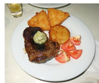
Oferta do Dia

コントラフィレをフライパンで焼いたものに薬草ハーブ入りバターを付けて食べます。ややお肉が焼き過ぎで硬めでしたが、味はしっかりしていました。