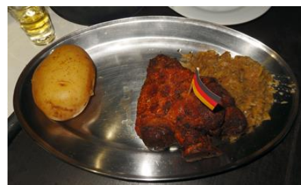
Joelho de Porco def. Assado (Pururuca) com Chucrute e Batata

味付けマリネードされた豚の膝を油で揚げ、パリッとした触感に仕上がっています。サワーキャベツと一緒に食します。 お酒のおつまみには最適です。